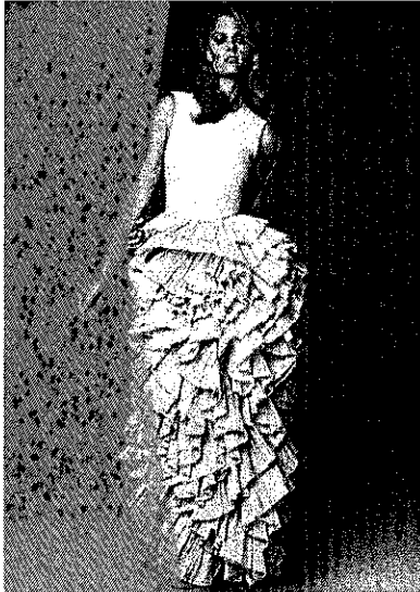
H&Mの新コレクション「EXCLUSIVE CONSCIOUS COLLECTION」より、ドレス(価格未定)。4月20日(金)より渋谷店、4月21日(土)より名古屋松坂屋店にて発売予定。